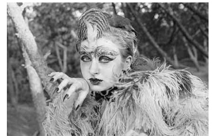
Die Betörung der blauen Matrosen , Ulrike Ottinger

Download Pressefotos: www.jacksmith.extratrouble.de/Service/Pressematerial